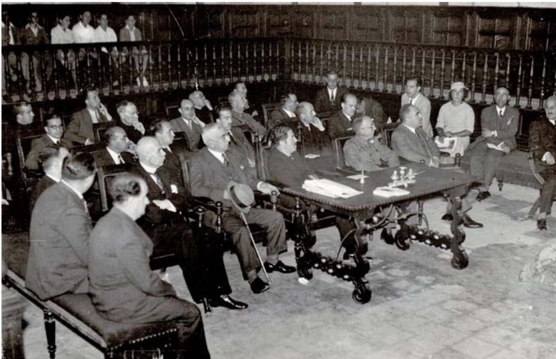
Apertura del curso 1935-1936 del CEU, en la Universidad de Alcalá de Henares

Felicitación por el Día Internacional de los Archivos, 9 de junio: